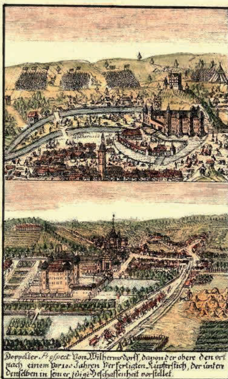
Wilhermsdorf im Jahre 1748