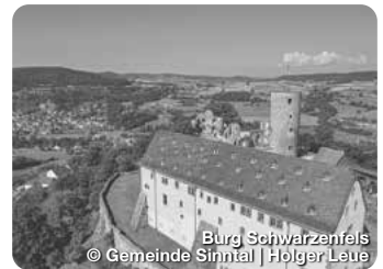
Burg Schwarzenfels

Das Schloss, dessen Ursprünge bis ins 16. Jahrhundert zurückreichen, wurde im Stil der Neorenaissance umfassend renoviert und erweitert. Parkstraße 2, Schlüchtern