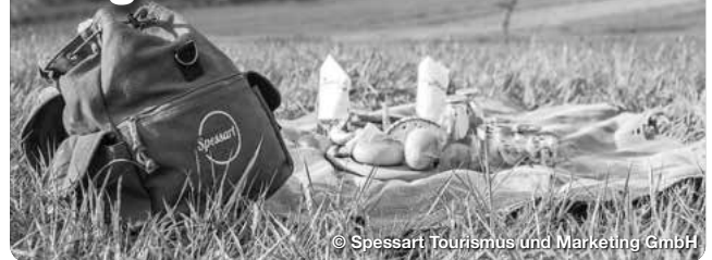
© Spessart Tourismus und Marketing GmbH

Der Spessart bietet viele verträumte Orte, die sich für ein Picknick mit dem Lieblingsmenschen eignen. Wer sich nicht mit der Vorbereitung oder zusätzlichem Gepäck plagen will, kann auf fertig zusammengestellte Picknick-Körbe zurückgreifen: Mit zwei Picknickstationen ermöglicht der Naturpark Hessischer Spessart unkomplizierten Genuss am Wegesrand.