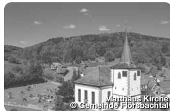
Mattheus Kirche

Das Heilbad am Spessart - ist bekannt für seine außergewöhnlich starken Solequellen, die u.a. in die Becken der Spessart Therme fließen. Die Stadt bietet spannende wie entspannende Möglichkeiten für Gesundheitsurlauber, Familienausflüge und Genusswanderer. TreffpunktDeutschland.de/bad-soden-salmuenster