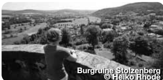
Burgruine Stolzenberg © Heiko Rhode