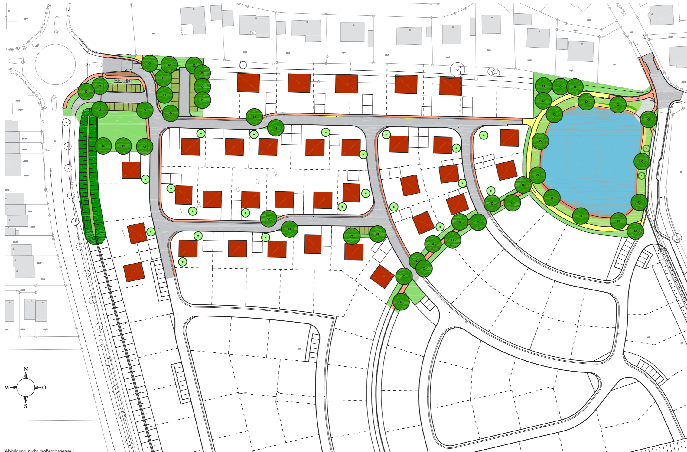
Abbildung nicht maßstabsgetreu!

Nähere Auskünfte erhalten Sie beim Markt Wilhermsdorf.